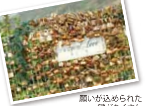
願いが込められた 鍵がたくさん

道後平野や伊予灘を望む高台で、美し い景観を一望。夕暮れもロマンティック。上 り線は鍵・下り線は寄り添う二人のモニ ュメント。記念写真スポットにもぴったり。