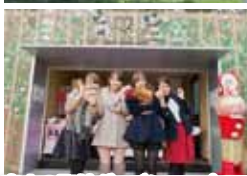
恋人の聖地グッズショップ (土日15:00~17:30営業)

静岡県浜松市北区三ヶ日町佐久米47-1 サービスエリア・コンシェルジュ ☎053-526-7220