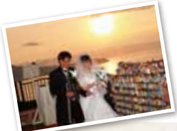
結婚のステージ にというカップルの 希望も叶う