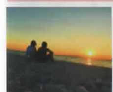
夏の夕暮れ (奈良県:yu-kaさん) 撮影:りんくうマールビーチ