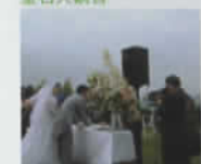
神石高原/福ヒコキタワー