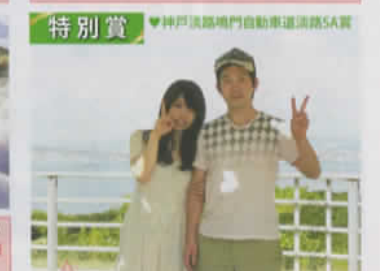
特別賞 ♡神戸淡路湾門自動車道淡路SA賞 婚約指輪をもらった思い出の場所。毎年記念日に来ていて、ハートがかわいく写った♡ (兵庫県:kieさん)