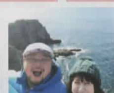
笑わせすぎ、楽しすぎ! (大阪府:acoさん) 撮影:朝紀白浜三段壁