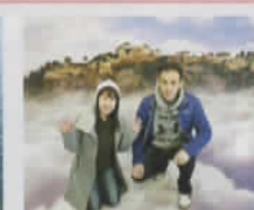
結婚20周年記念 (和歌山県:ちだちゃんさん)