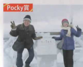
50年前に新婚旅行、思い出の聖地へ金婚式旅行! じいちゃんばあちゃんラブです! (東京都:金婚式を迎えた貴様夫婦さん)