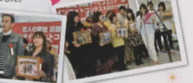
第4回 授賞発表会 (2018.3.19) 神戸淡路湾門自動車道淡路サービスエリア