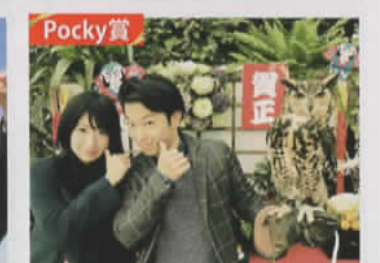
2人とも1月10日生まれ1月は特別な月! (神奈川県:いちご野郎さん)