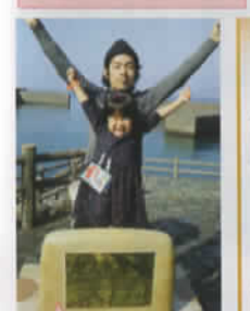
初めて来たぞー! (高知県:ゆうみさらさん) 撮影:大山陣(太平洋展望台伊達本海浜石積屋)