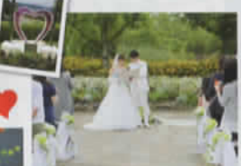
草津市立水生植物公園みずの森