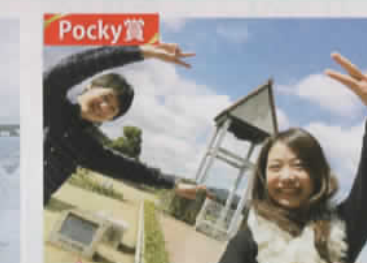
快晴の美術館 (長野県:えばっちさん)