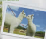
那須どうぶつ王国