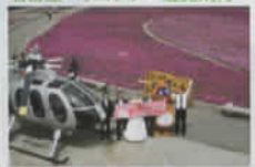
茶臼山高原/芝桜の丘