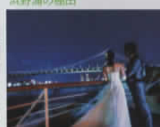
東京ベイクルーズガゼンフォニー