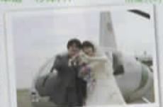
名古屋ヘリコプター遊覧飛行