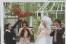
神戸どうぶつ王国