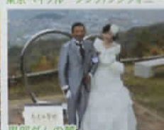
黒部ダム北の麓 信濃大町一北アルプスハートロード