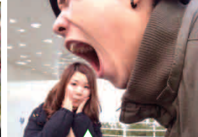
がおお(香川県:かっちゃん) 撮影:神戸淡路鳴門自動車道/淡路サービスエリア