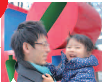
おとうさん、だ〜いすき(東京都:mico) 撮影:新宿アイランドタワー/LOVE