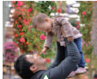
「パパが一番!」ラブラブ父娘です。(兵庫県:nyaoko0222さん)