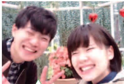
しあわせ(兵庫県:まなびー)