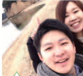
初の小島旅行。たくさん思い出をつくって、いずれは「恋人の聖地」でプロポーズしたいです!! (滋賀県:ノンノ) 撮影:エンジェルロード