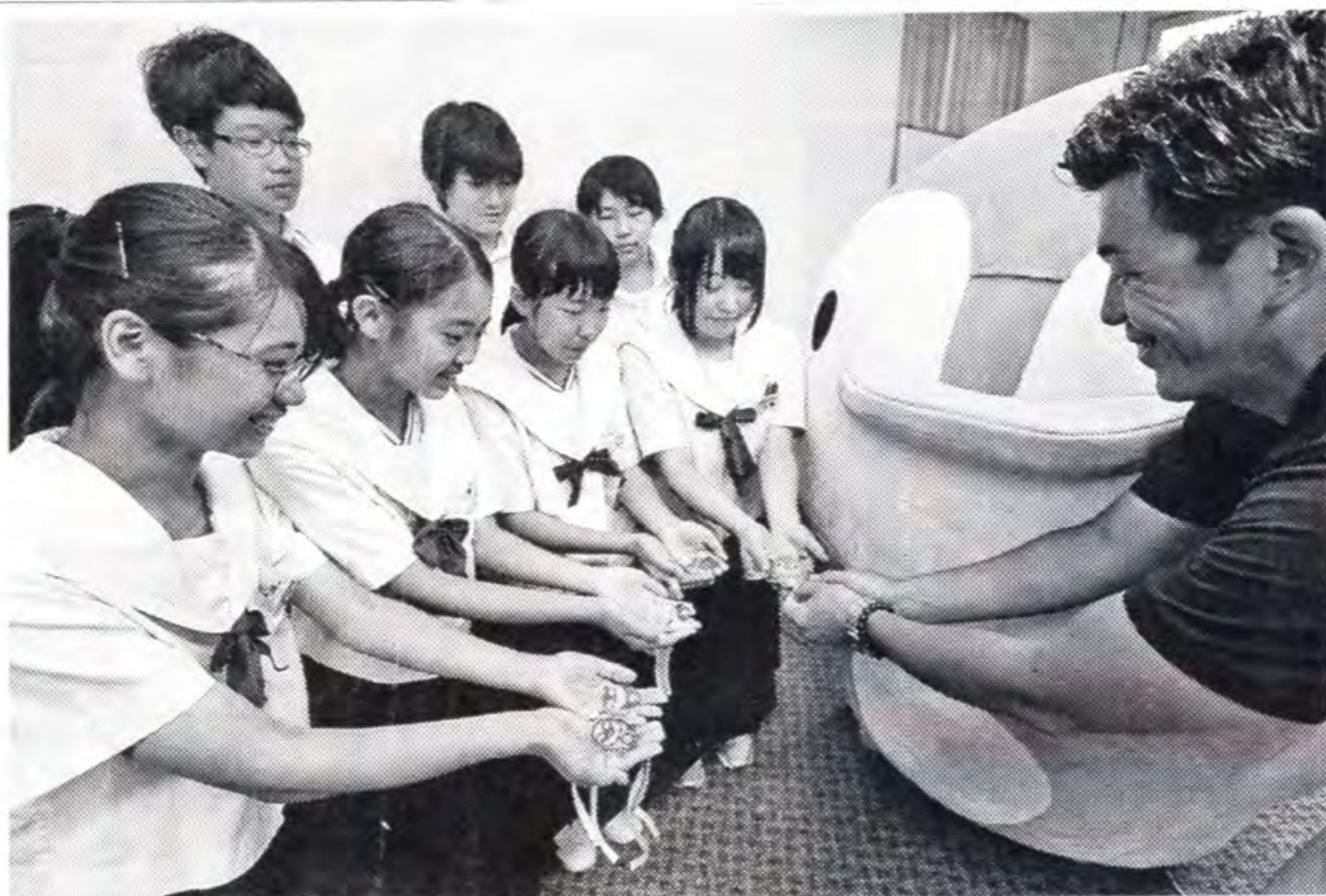
リボン付きキーホルダーの試作品を見せる白浜中学校の生徒たち（左） ＝白浜町の町商工会館で

旅行の際に大手おもちゃメー カーを訪問。商品開発には目 的やターゲットなどを考える 必要があると助言を受けた。 その後、授業でも検討を進め てきたという。