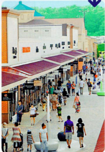
⑧新規ショップも、そくそくとオープンしている

那須エリアに出かけるなら絶対にはずせないショッピングスポット。東京ドーム約4個分もの広い敷地内には142のショップが集まり、キッズガーデンやドッグランも併設されている。那須口コママーケットでは新鮮な高原野菜やご当地スイーツ、乳製品など地元の特産品が勢揃い。350席もある広々としたフードコートをはじめ、カフェやファーストフードなどが20店舗以上と、グルメスポットも充実しているので、買い物帰りには食事にも楽しみたい。 DATA ④栃木県那須塩原市塩野崎184-7 ⑤10～19時(季節・曜日により変動あり) ⑥無休 P2500台 ⑦MAP P123B4