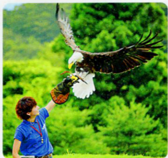
④動物のパフォーマンスを効率よく見るなら先に開始時間をチェック!

広大な敷地に150種、600頭の動物たちが、王国タウンと王国ファームの2つのエリアに分かれて暮らしている。動物との距離が近く、直接ふれあったり、エサやり体験が楽しめるほか、室内で動物を見学できるエリアもあるので、悪天候でも安心。動物本来の身体能力を間近で見られる動物のパフォーマンスショーも充実。 DATA ④栃木県那須郡那須町大島1042-1 ⑤入園2000円(冬期は要問合せ。2018年3月17日より料金改定予定) ⑥10時～16時30分(土・日曜、祝日は9～17時) ⑦水曜(春休み、GW、夏休み、祝日は営業、冬期は要問合わせ) ⑧P2000台(有料) ⑨MAP P123B1