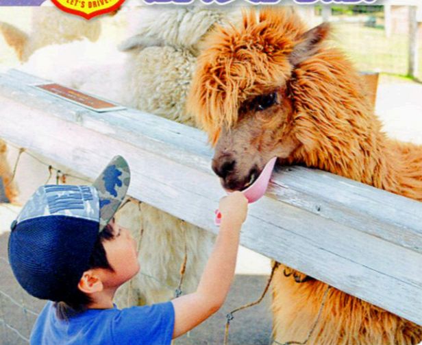
人気者のアルパカ。エサやり体験100円もできる