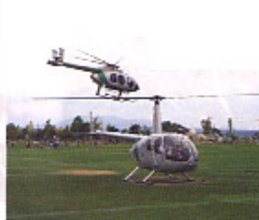
④最大3人まで搭乗可能!カップルから家族連れまで幅広く楽しめる!