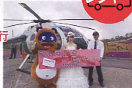
④ヘリコプターを使った結婚式の演出もしてくれる