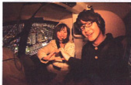
④恋人同士で素敵な時間を過ごせる