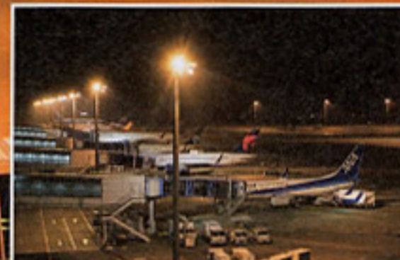
19:00からは、徐々に国際線の飛行機が増える。カラフルなデザインが多い海外の飛行機が夜景に映える

東海エリアの空の玄関口、中部国際空港セントレア。人けの少ない夜の空港は、幻想的なムード満点でテートにピッタリだ。