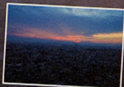
太陽が沈む直前、空は幻想的な表情を見せる。チャンスはほんの数分