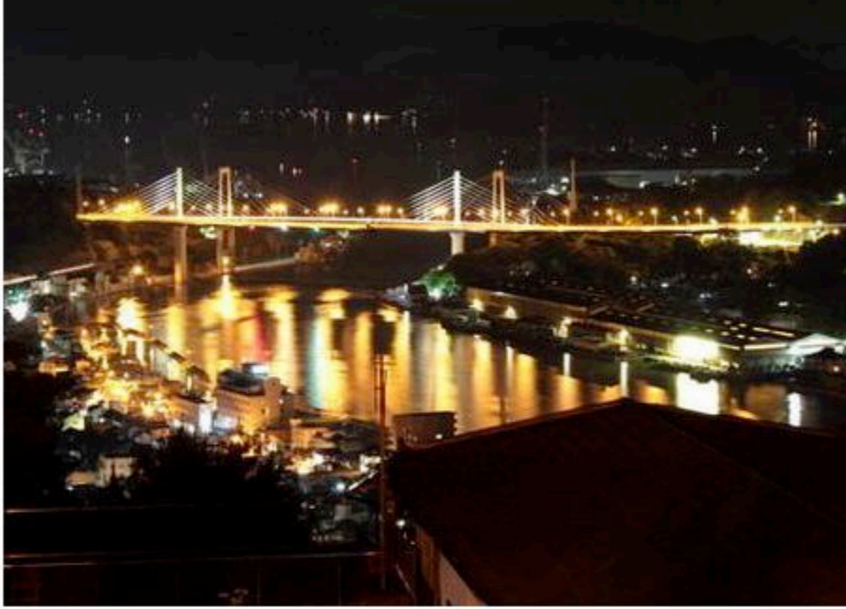
尾道 千光寺公園からの夜景、光と静けさを味わう恋人の聖地