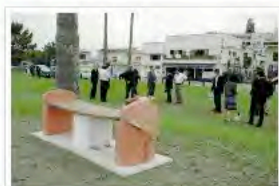
設置されたベンチ (館山市北条で)

「恋人の聖地」としてNPO法人の認定を受けている館山市で、北条海岸北条栈橋のもとにカップルが寄り添える3基のベンチが設置された。館山ロータリークラブ(RC)が創立60周年記念として市に寄贈し、1日、現地で贈呈式が行われた。