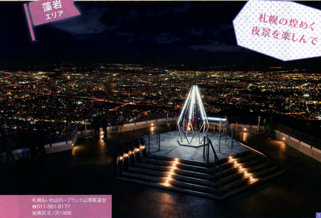
札幌もいわ山ロープウェイ山頂展望台 ☎011-561-8177 住南区北ノ沢1956