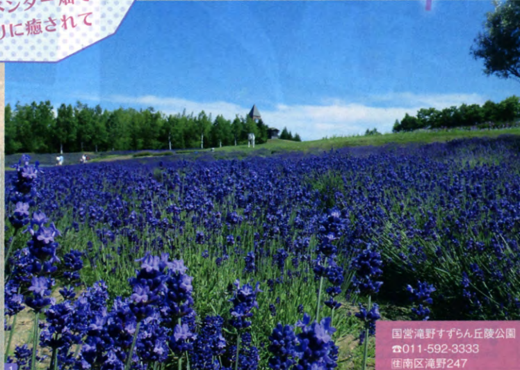
国営滝野すずらん丘陵公園 ☎011-592-3333 住南区滝野247