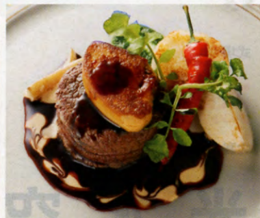
▲高級食材を惜しみなく使った逸品も華麗に登場