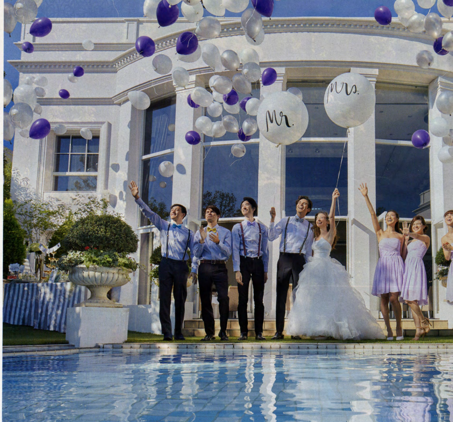
▲洗練されたアーバンスタイルをコンセプトに、上司や年配ゲストも満足の吐息をもらす一日がここなら実現。大空へ風船を解き放つ盛大なバルーンリリースをオープニングに、ハッピーな時間を大勢のゲストと楽しもう