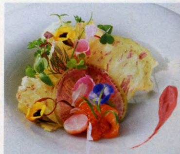
▲見目麗しい皿の数々が舌の肥えたゲストをも魅了