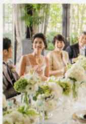
▲温かな少人数会※詳細は直接問合せ