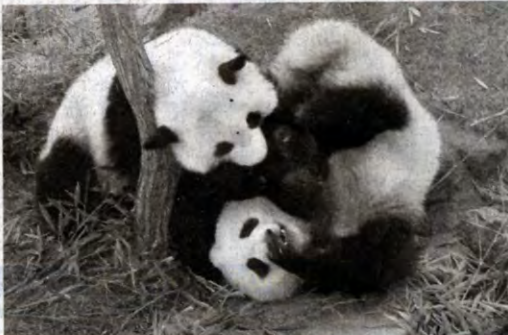
桃浜、桜浜姉妹にきょうだいができるでアドベンチャーワールドでは交配が確認されたときは、ほ ぼ生まれている。回も双子の赤ちゃんが期待される。

○…パンダの赤ちゃんが双子の確率は約50%というが、アドベンチャーワールドは双子家系で、これまで生まれ育った14頭のうち、1人っ子が、だったのは2000年生まれのみだ。それ以外は1頭が生後間もなく死んだり、死産だったケースを含め、双子だった。また、これま