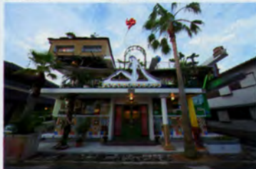
大竹伸明 直島銭湯「I♡湯」(2009) 写真: 渡邊修

◎香川県香川郡直島町2252-2 ☎087-892-2626 ◎14:00~21:00(土日祝は10:00~) ◎月曜日