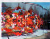
犬島「家プロジェクト」A部 覚神明香「リフレクトゥ」,2013

集落の中にギャラリーが点在。民家の隣に唐突に作品が存在する、不思議な世界観が魅力的。