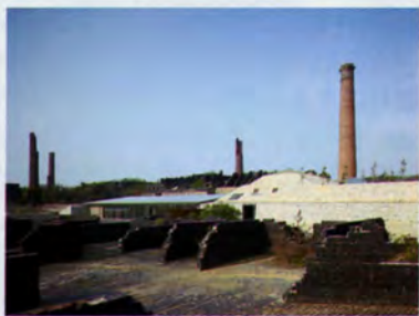
犬島精錬所美術館

醤油やオリーブ、そうめん等、小豆島は特産品の宝庫。女子が嬉しいお土産がいっぱい♡