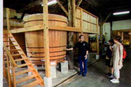
香ばしい醤油の香りに包まれながら、蔵を見学♪