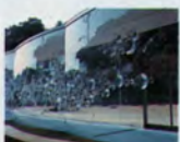
犬島「家プロジェクト」S部 覚神明香「コンタクトレンズ」,2013