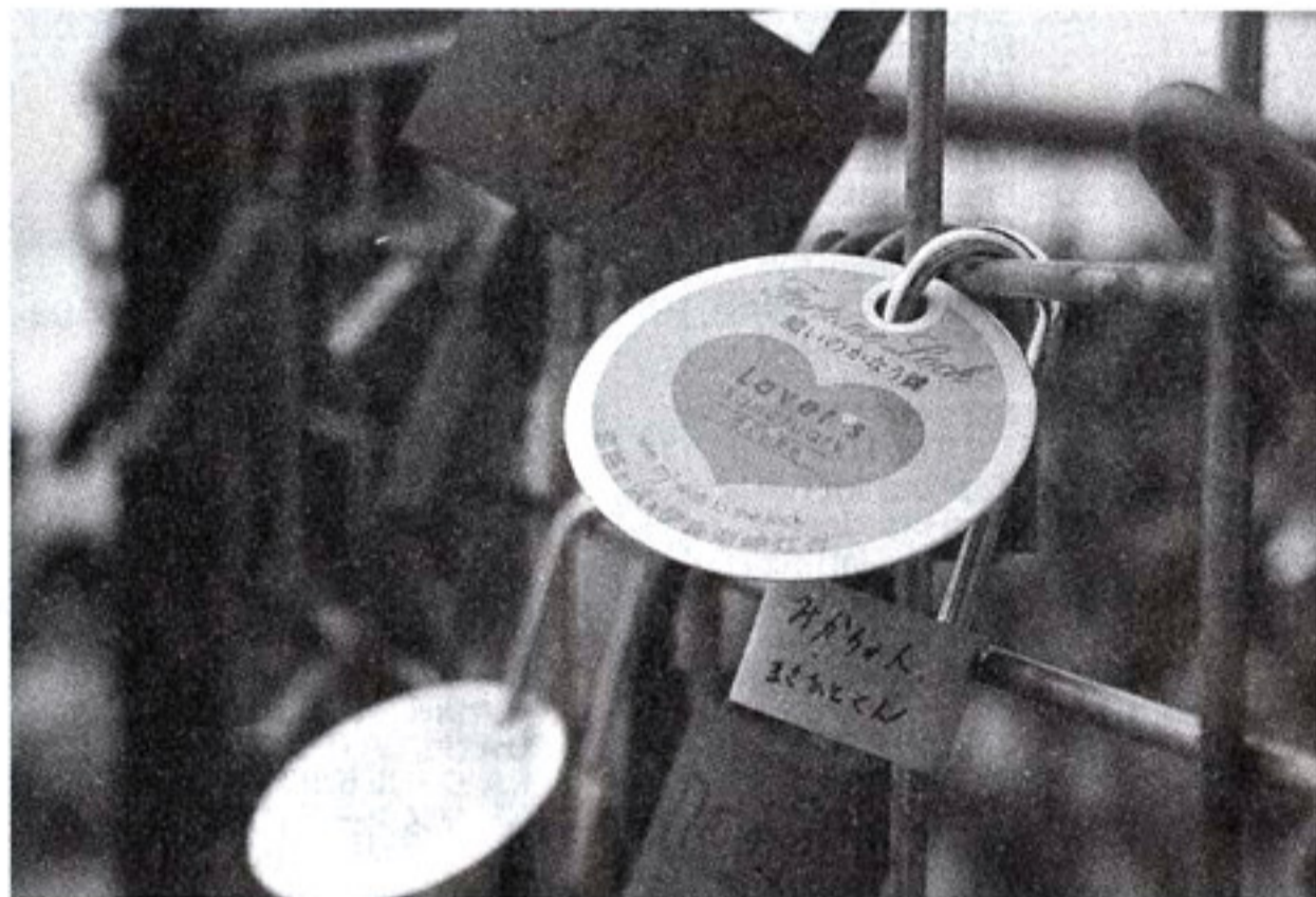
恋人の聖地で二人だけの約束を(願いのかなう鍵)