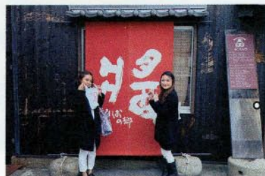
醤油の香りが漂っていました