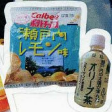
オリーブのお茶もさっぱりしていて美味しい!