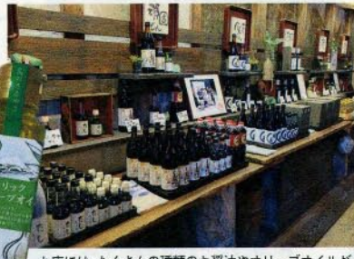
お店には、たくさんの種類のお醤油やオリーブオイルが。どれも美味しくそうで、全部欲しくなります。

130年以上続き、現在5代目店主が守っている「金両醤油」。明治時代から使い続けている杉桶と蔵を特別に見学。芳醇な香りが満ちた蔵には、目には見えない酵母菌が棲みつき、それらが美味しい醤油を生み出しているそう。