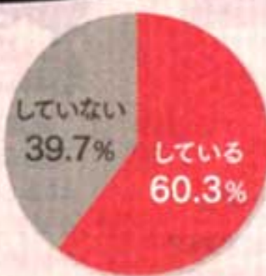
※調査期間 = 2016年1/14~19、有効サンプル数398 ※対象 = 福岡在住の20歳以上の既婚女性

ちなみに、デートの行き先で多かったのは映画館。2人で出かけられるチャンスがあれば、足を運んでみては。