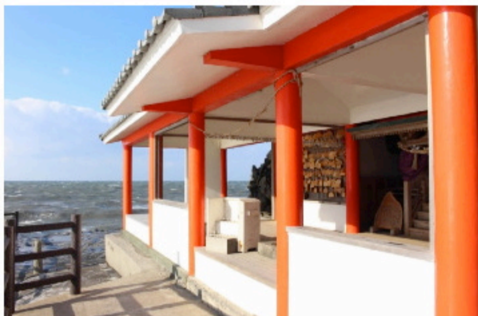
海にせり出した場所にあつて、縁結びの神様を祭る粟嶋神社＝豊後高田市の粟嶋公園