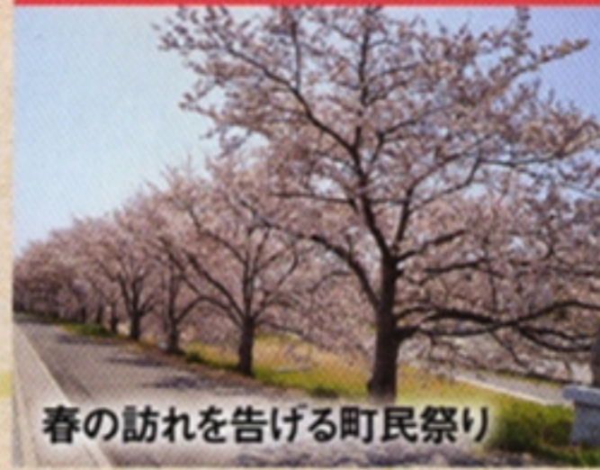
春の訪れを告げる町民祭り