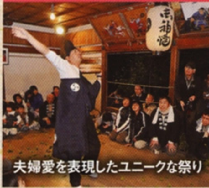
夫婦愛を表現したユニークな祭り