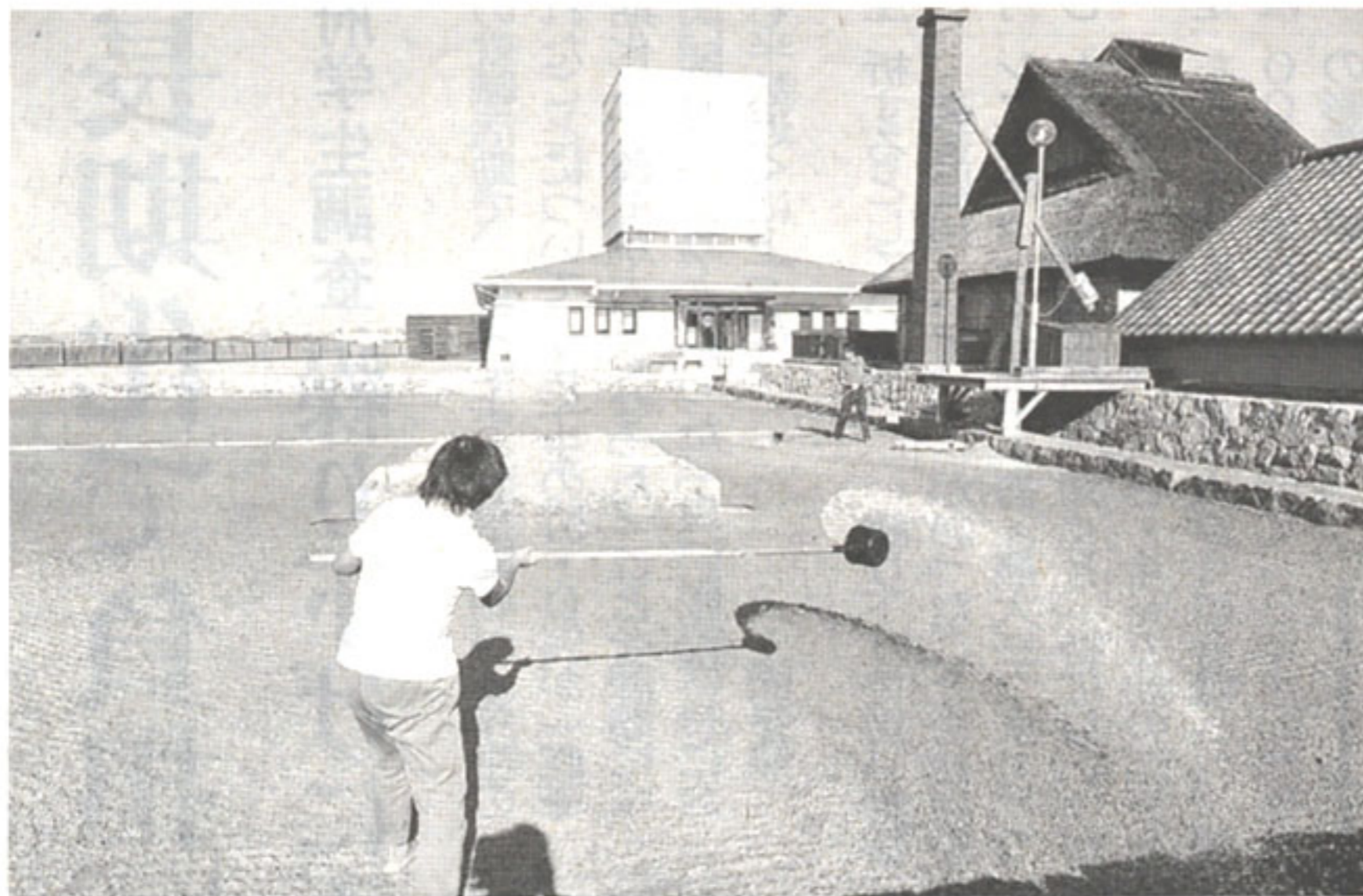
塩の町・宇多津を今に伝える復元塩田。昔ながらの技法で塩が作られている(写真はいずれも香川県宇多津町浜一番丁)