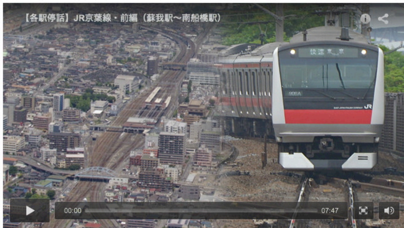
【動画】 【各駅停話】 JR京葉線・前編(蘇我駅～南船橋駅)