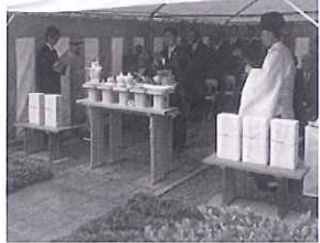
安全祈願祭の様子

行を祈念しました。 11階、15階にあるレストラン街スライスは、平成2年に全面改装して以来25年が経過し、設備などの老朽化が進んでいたことから、東武百貨店の行う店舗リニューアルにあわせて改修工事を行うものです。