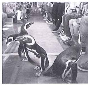
電車の中を行進するペンギンたち