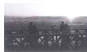
蔵王ロープウェイ山頂駅