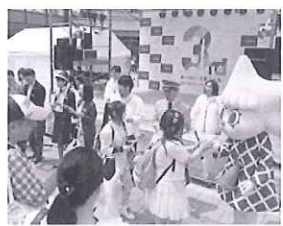
「善」プレゼントの様子

開業3周年当日の5月22日には、4階スカイアリーナにおいて、「笑顔の橋渡し」という想いを込めてオリジナル記念品の「善」を先着1,000名のお客様にプレゼントしました。