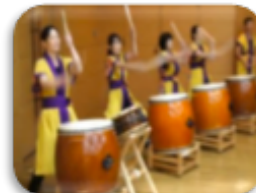
折り返し地点で応援太鼓(川西町・風姿花伝)