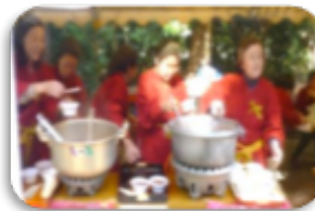
ふるまいぜんざい(三宅町婦人会)