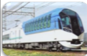
10時45分頃しまかぜ高架下を通過します。