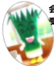
結崎ネブカ・マスコットキャラクターネツピー