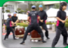
オープニング演奏(屯倉和太鼓心舞)