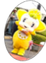
三宅町公式マスコットキャラクターみやっぴい