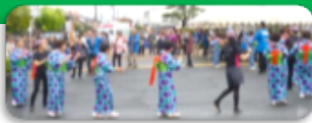
おもてなし太子音頭