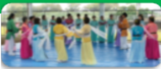
おもてなし天平の舞

京奈和自動車道の一般部(高架下部)が平成27年3月28日(土)に開通します。 今回、普段は歩くことが禁止される車道部分の一部を開通前に特別に解放し、記念に歩きます。