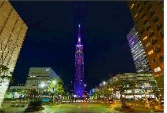
福岡タワーにハートのイルミネーション!バレンタインデーの夜を演出☆