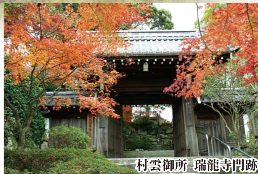
村雲御所 瑞龍寺門跡

※団体割引もございます。詳しくはお問合せください。 ※季節・行事により随時延長いたします。 ※毎時15分間隔で運行しております。 ※団体さま、また多客の場合は、連続運転いたします。 ※料金は2015年1月1日現在のものです。改定する場合がありますので、ご利用前にご確認ください。