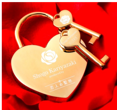
① 「Love Love Key Tower」