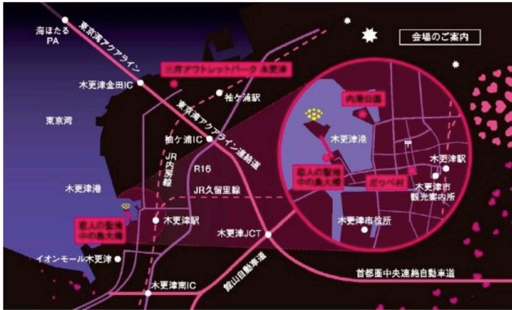
【木更津港内港公園案内地図】

※第8回（2月14日）については、木更津港内港公園で、音とコラボした特別な花火を行います。