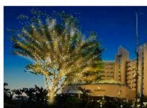
イルミネーションホテル正面【拡大】

「南紀白浜温泉 コガノイベイホテル」(所在地:和歌山県西牟婁郡、運営:カラカミ観光株式会社)が「恋人の聖地」に認定されたことを記念して、2014年11月5日(水)からホテル内の庭園に白浜の海をイメージした約30万球のイルミネーションを設置、一年中楽しめるロマンチックスポット「Illuminous Ocean(イルミナス オーシャン)」として営業を開始いたします。