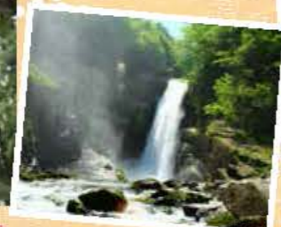
▲高さ55mから流れ落ちる様は圧巻！是非ご応募を♪