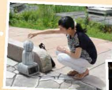
▲お地藏さんの表情がそれぞれ異なるのも見どころ。お湯はやさしくかけてね

お地藏さんに恋のお湯かけ小瓶のお湯をかけてめぐると、恋の願いが成就するとか。国道沿いにあるので車には要注意。