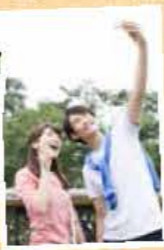
▲秋保で記念撮影したら