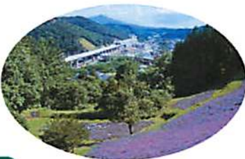
ラベンダー園からは、いわて沼宮内駅、秀峰・姫神山が眺望できます。写真撮影には絶好のポイント。