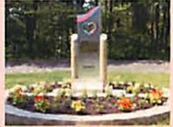
恋人の聖地 石神の丘美術館は2008年『恋人の聖地』に認定され、屋外展示場には銘板をはめ込んだ記念碑が設置されています。