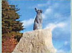
アートロード いわて沼宮内駅から美術館までのおよそ800mには「いわての動物たち」の彫刻が並んでいます。