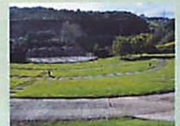
野外劇場 石でできた舞台に芝生の観客席。さまざまなスタイルのステージが楽しめます。