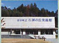
石神の丘美術館ギャラリー 企画展を楽しめる展示室、ホール、眺めの良いテラスがあります。屋外展示をこころなる憩いにもこちらから入場となります。