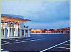
道の駅・石神の丘 新鮮野菜や特産品を扱う産直、地元の食材にこだわったレストラン、茶屋っこなど、美味しいものがたくさん。