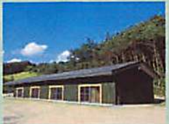
工房 陶芸窯、版画プレス機を完備。作ることを楽しみ、学ぶ創作体験教室やいろいろな講座が開催されます。