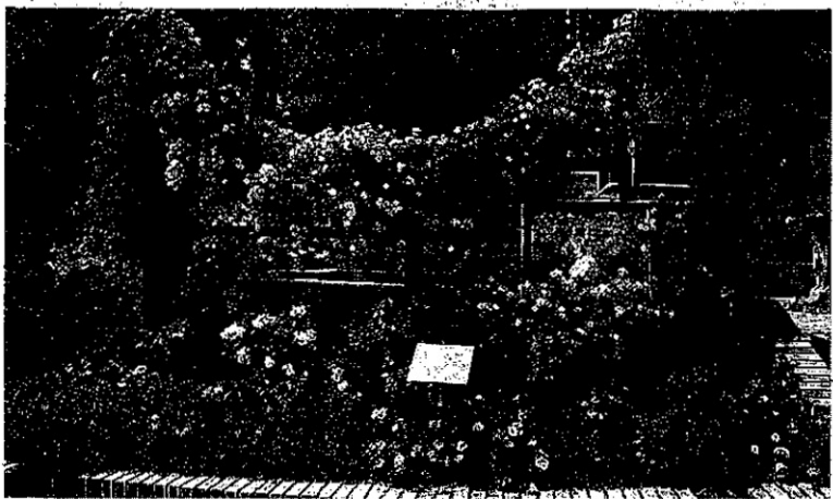
①琵琶湖遊覧船「ミシガン」②琵琶湖汽船提供③「ガーデンミュージアム比叡」の園内④同庭園提供