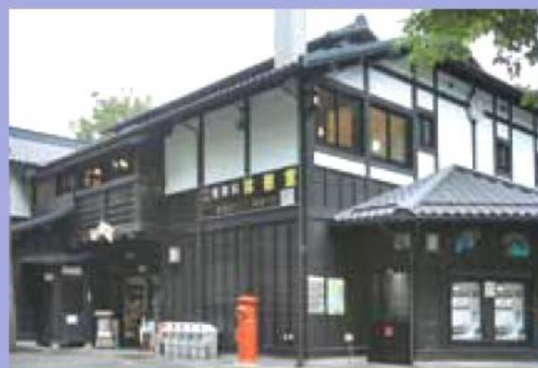
龍泉洞レストハウス

お目当ての龍泉洞へと誘う龍泉洞橋のすぐ右側にあり、入洞券売場やレストハウス、さらに無料休憩所(2階)を兼ねた施設です。