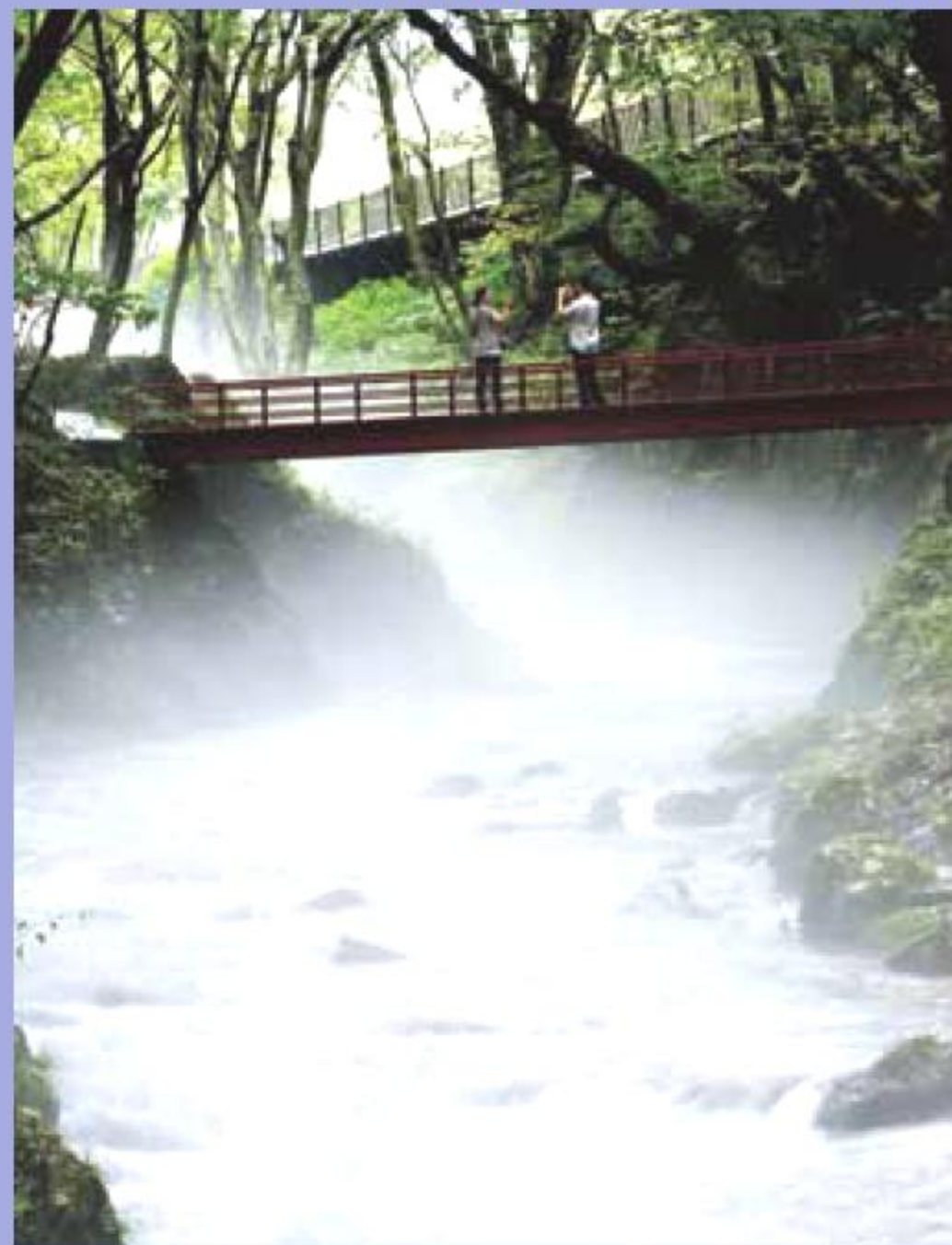
その名の通り清い川 清水川(しずがわ) MAPH-4

龍泉洞からの伏流水が流れ込む清水川は、四季折々の表情を川面に描きます。夏、龍泉洞を取り巻くように流れる清水川は、観光客に涼を与えてくれるのです。