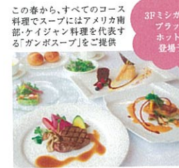
「四季のお勧めコース」4,000円(4/1からは4,110円)