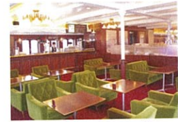
「パドルパンケーキ」や「エッグベネディクト」が味わえる、2Fのミシガンカフェ