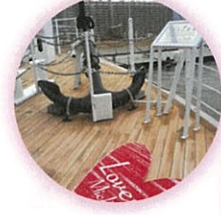
船首に、ふたりの思い出になる撮影スポットができました