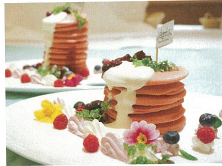
ミシガンのパドル枚数と同じ、最大12枚まで注文できる「パドルパンケーキ」400円。は、シェアして食べるのがオススメ(値段は枚数により異なります)。このほかにも各種パンケーキが充実

春からのミシガンは、これまで以上に楽しくなります。 料理長が腕を振るう本格的な定番コース料理のほか、オリジナリティあふれるカフェメニューが日々登場。 日本初、船上の「恋人の聖地サテライト」に認定され、美しいイングリッシュガーデンが広がる 柳が崎湖畔公園港への寄港もスタートします。ぽかぽか陽気に誘われて、春の湖上へ。