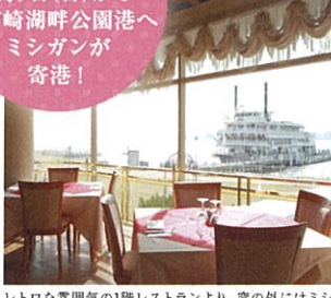
レトロな雰囲気の1階レストランより。窓の外にはミシガンが着船する機橋が見えます