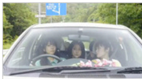
製作 神石高原町観光協会