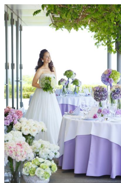
ホテル・ド・比叡