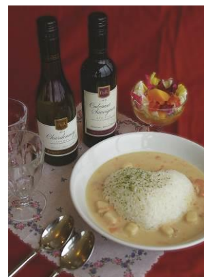
ラバースシート特別ニュー