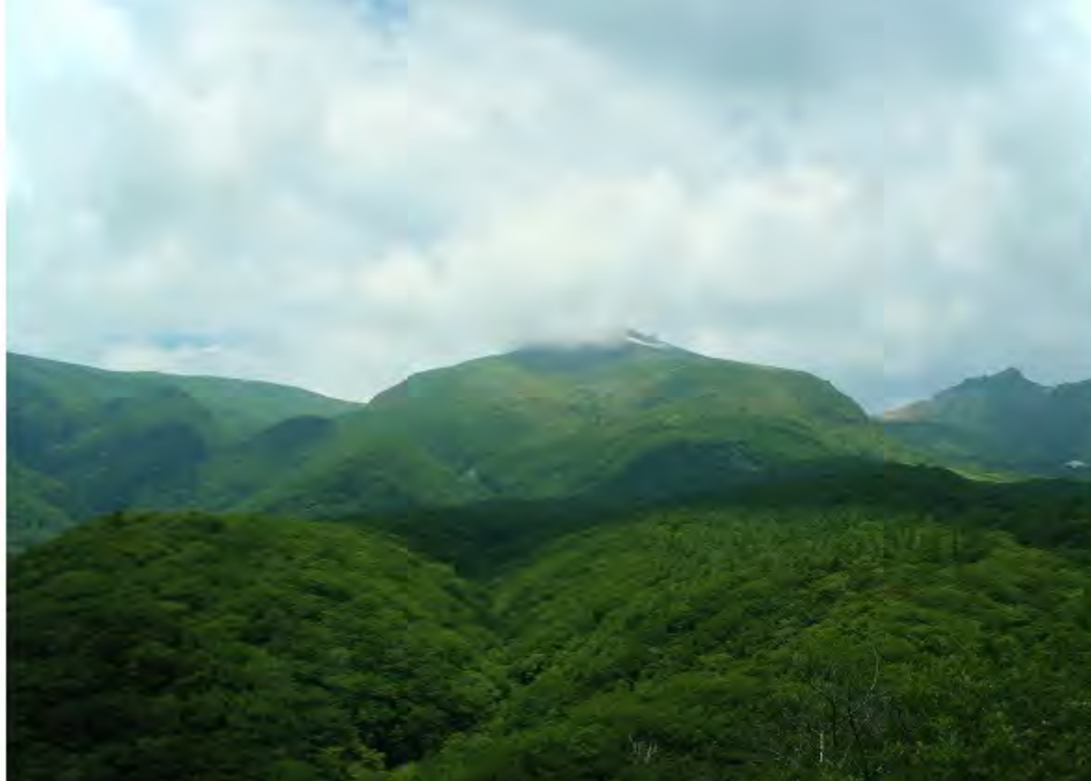
↑ ↑ 見晴らしの良い展望台で 山々も望めますし、