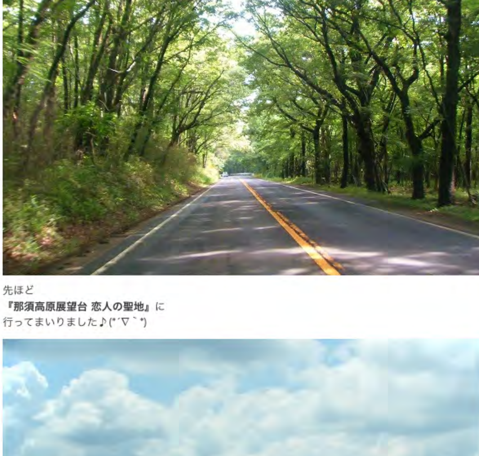
先ほど『那須高原展望台 恋人の聖地』に行っていました♪(“▽”)

今朝の那須街道（県道17号線） 木々のトンネルの中を 毎朝、通勤しています。(“▽”) ↓ ↓