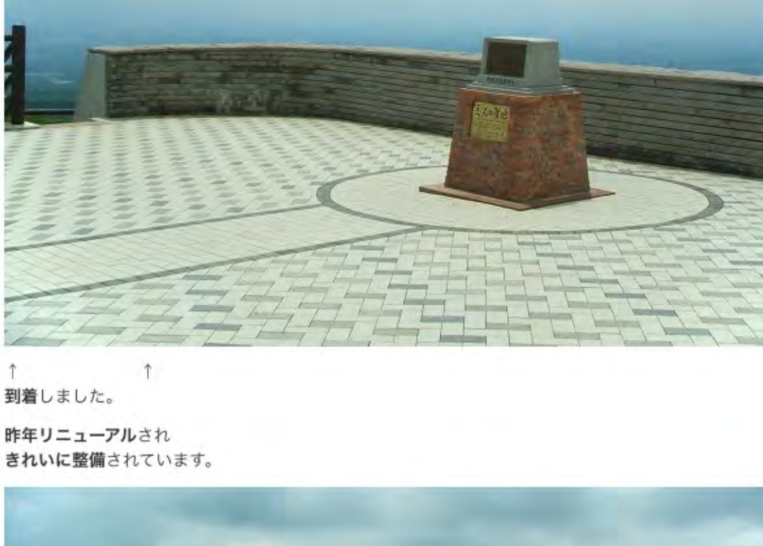
↑ ↑ 到着しました。