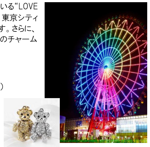
(右上)お台場・パレットタウンの大観覧車 (左下)プロミス・ベア