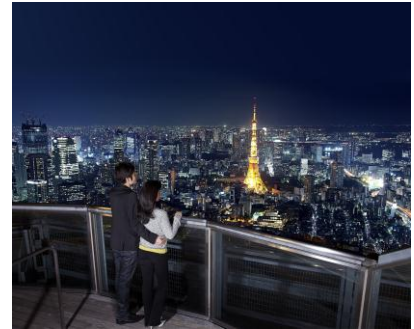
スカイデッキからの夜景(イメージ)

海拔 270 メートル、六本木ヒルズ森タワー屋上に位置する「スカイデッキ」では、恋人達のために金・土・祝日前日の営業時間(通常 20 時)を 22 時まで延長します。ディナーの後にゆっくりと、ふたりで、息を呑む美しさの夜景を鑑賞しながらロマンティックな夜をお楽しみいただけます。また、スカイデッキには、“恋人の聖地”のプレートが設置されているので、記念撮影スポットとしても人気です。