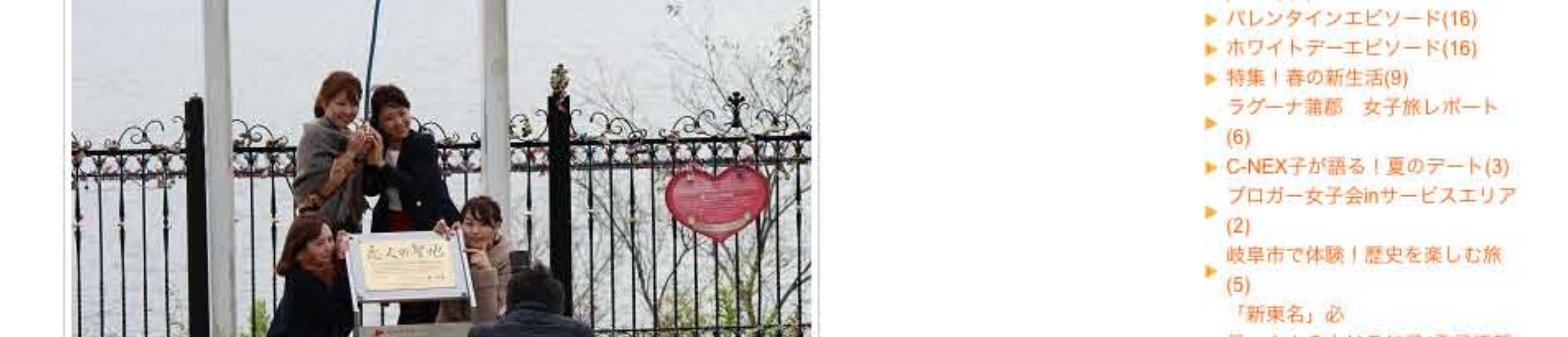
真剣に撮影しているかと思いきや... ♪ チュートレイン ♪ とお遊びも満載 ♪