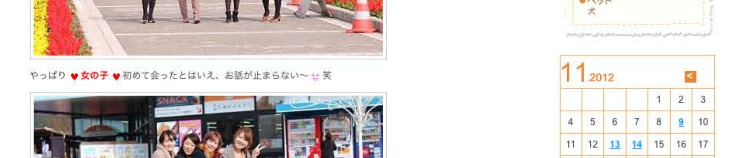
みんなでキャピキャピしてすでにお友達4人組～ ♥