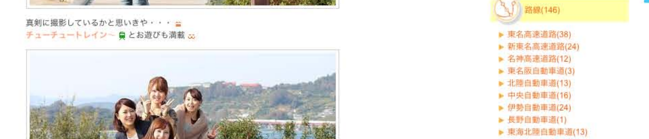
楽しすぎて時間はどんどん予定から遅れていき... ♪ とうとう"巻き"の指示まで出てしまい... 笑

お花見のシーズンはみんなで外でランチ ♪ したいね～なんて言いながらブラブラしました ♪