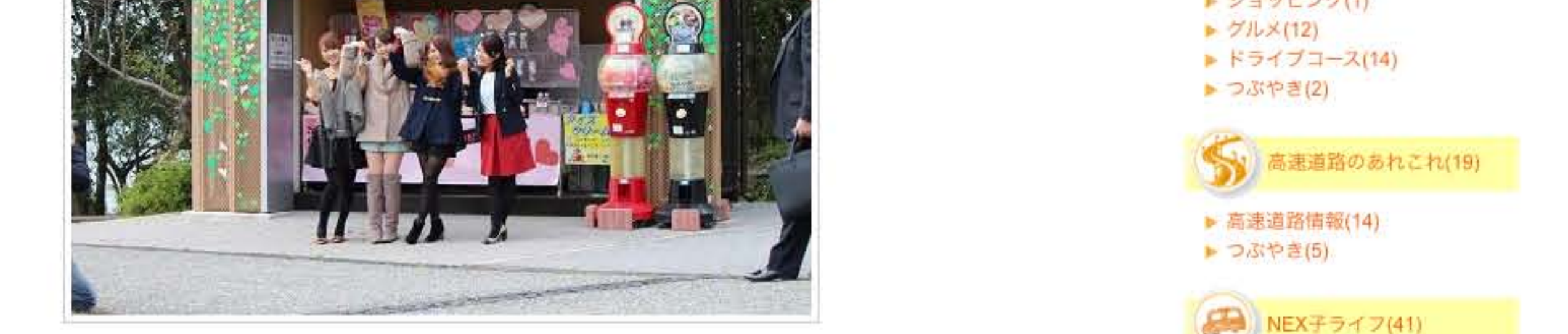
風が吹いていて大変な撮影でしたが、 「あのかへね～を撮らすのは～♡」なんて歌いながら楽しく進み... ♪