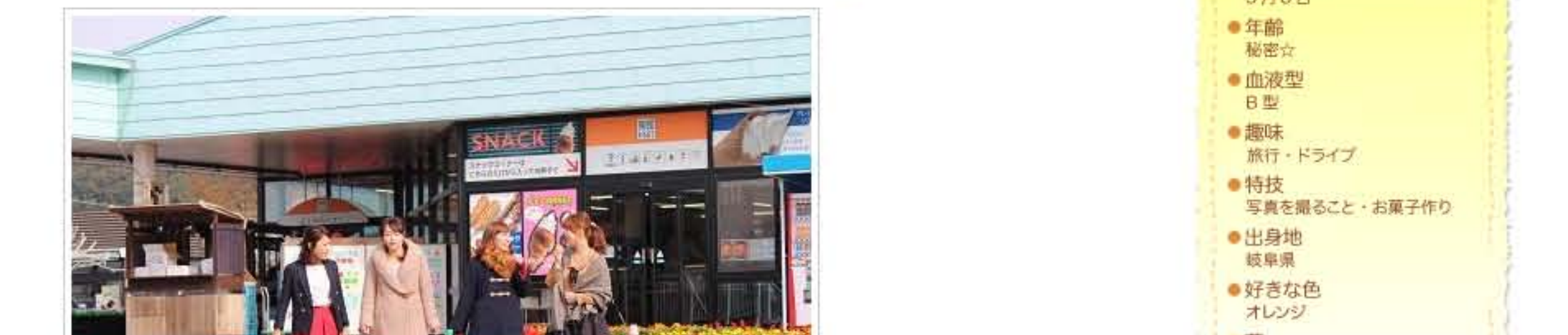
やっぱり ♥ 女の子 ♥ 初めて会ったとはいえ、お話が止まらない～ 笑

実際お会いすると、とっても気さくで何よりかわいい～ ♥ 出会って15分で、すでにミスキャンパス組・C☆NEX子組関係なくみんな仲良しでした ♪