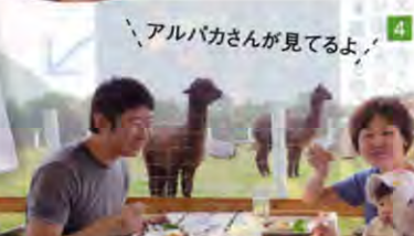
ゆっくり食べてね