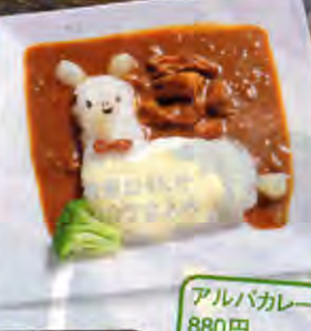
アルパカカレー 880円