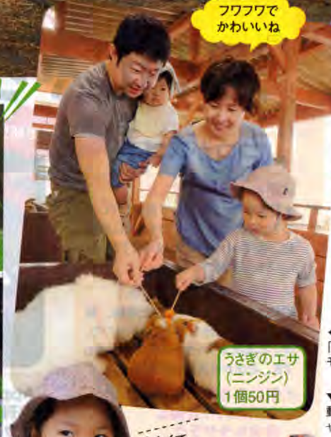
フワフワでかわいいね