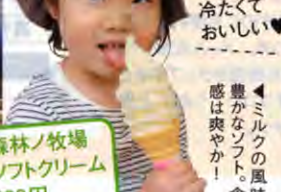
冷たくておいしい! 豊かなソフト、食味は爽やか!