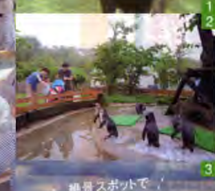
絶景スポットで記念撮影も!