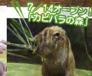
7/14オープン! 「カピバラの森」