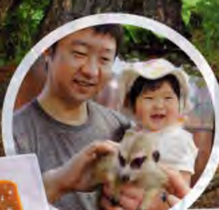
「スモールアニマルハウス」でミニアニマルをなでなで