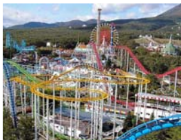
那須ハイランドパーク

通常のメガ合コンは市街地の複数の飲食店を会場にお酒と料理を楽しみながら開催されます。那須ハイランドパークで日曜日の昼間に開催する「那須コン」は、様々なアトラクションやイベント館などを会場に、パートナーや友だちとの出会い、遊び、笑い、食の楽しみなどをミックスした、新しいタイプの「合コン」イベントです。