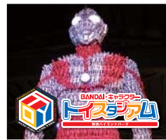
BANDAIキャラクター玩具スタジアム

那須の自然に囲まれたレジャーランド「那須ハイランドパーク」は10大コースターをはじめ、人気のアトラクション、イベント館など、大人も大満足の楽しさです。