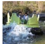
リバーアドバンチャー