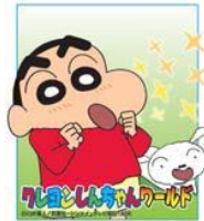
クレヨンしんちゃんワールド