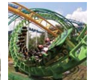
サンダーコースター