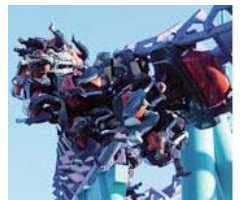
F 2 (エフ・ツー)