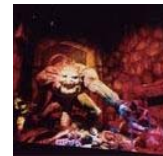
ダークキャッスル