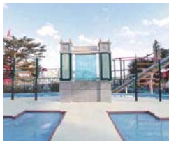
恋人の聖地サテライト(モニュメント)