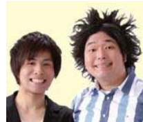
東海道 みものくボンガーズ(福島県)