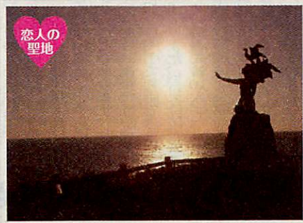
御前崎ケーブパーク内にある恋人の聖地「潮騒の像」

「御前崎ケーブパーク」内の展望台にある彫刻「潮騒の像」。2006年4月に、恋人の聖地として認定されています。水平線に沈む夕暮れ時の美しさは格別で、「日本の夕陽百選」にも選ばれるほど。晴れた日には、青い空と海に、「潮騒の像」の白い姿がすがすがしく映えます。