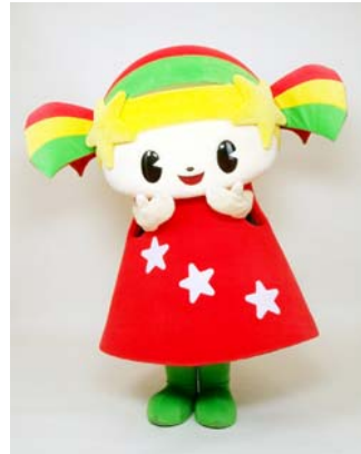
キララちゃん 京田辺市キララ商店街マスコットキャラクター