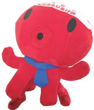
パパたこ たこフェリーキャラクター