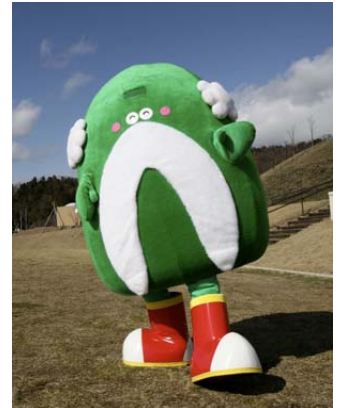
あわじい 淡路島のキャラクター