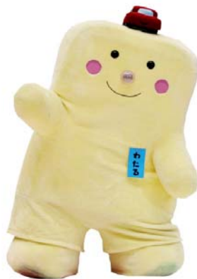
わたる 本州四国連絡橋シンボルキャラクター