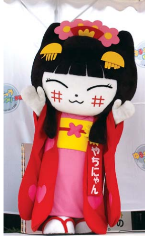
やちにゃん 彦根・四番町スクエアのキャラクター