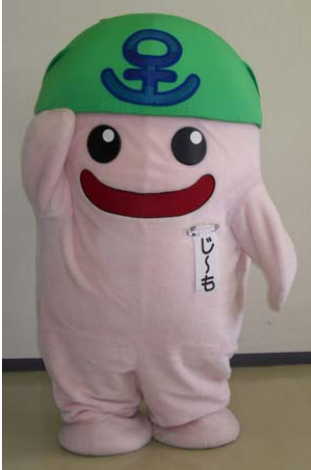
じーも 北九州市門司区のマスコットキャラクター

各地のキャラクターが出身地域の観光名所等をPR。グリーティング・記念撮影等により来場者との触れ合いを楽しみます。