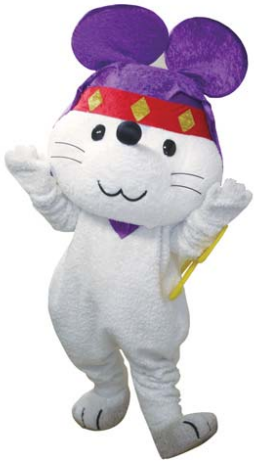
ひこちゆう 稲枝商工会公認キャラクター