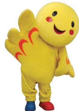
はばたん 兵庫県マスコットキャラクター