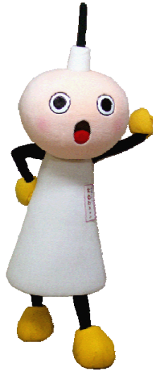
たわわちゃん 京都タワーキャラクター