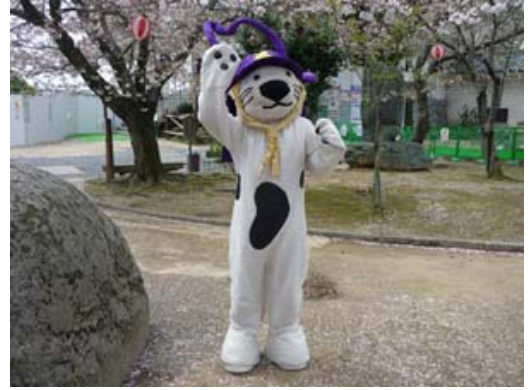
唐わん 唐津城築城400年イメージキャラクター