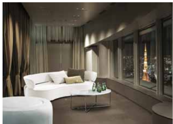
スウィート・ハート・ルーム イメージ