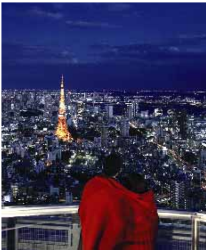
↑ 森タワー屋上「スカイデッキ」