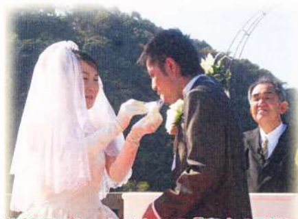
佐賀県でたったひとつの「恋人の聖地」

ここ浜野浦は、空と海と棚田が夕日に染まる美しい場所。恋人達が愛を語るにふさわしいとして佐賀県で初の認定を受けました。この地に立つ2人が永遠の愛で結ばれますように。