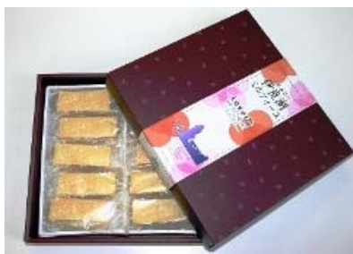
伊良湖ミルフィーユ ( 伊良湖リゾート )