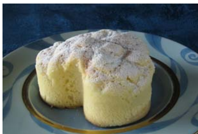
メロンの恋人 ( 伊良湖ビューホテル )