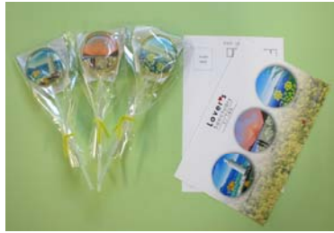
恋人の聖地グッズ フォトキャンディーとポストカード