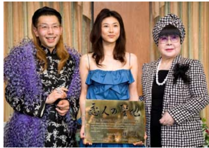
2006年4月19日 恋人の聖地プロジェクト 記者発表会にて