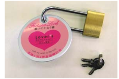
恋人の聖地グッズ 願いのかなう鍵セット (プレート・南京錠・ペン)