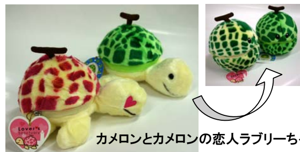
カメロンとカメロンの恋人ラブリーちゃん ( 伊良湖リゾート )