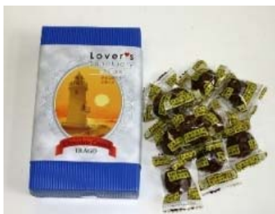
伊良湖チョコランチ ( 伊良湖リゾート )