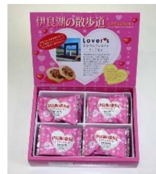
伊良湖の散歩道 ( 伊良湖リゾート )