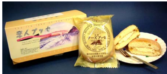
恋人ブッセ ( 休暇村 伊良湖 )