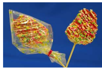
冬のいちご花火 ( ニュー渥美観光 )